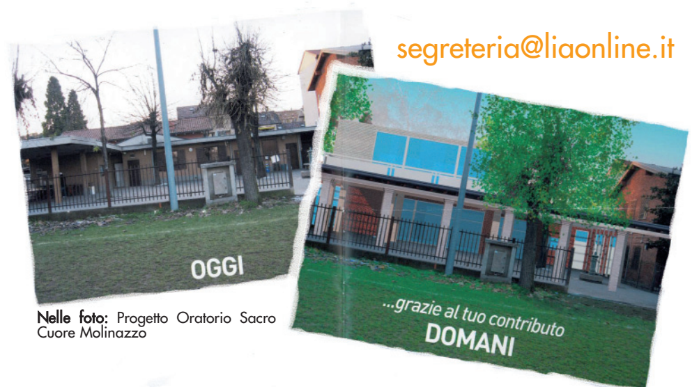
Nelle foto: Progetto Oratorio Sacro Cuore Molinazzo

creazione di una cucina per la convivenza delle famiglie.